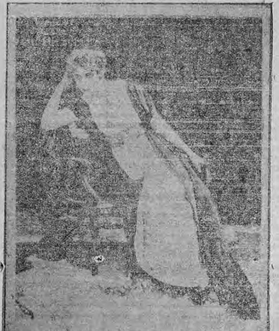
GABRIELLE ROBINNE EN "EL VUELO SUPREMO" ESTA NOCHE EN EL TEATRO AMERICA

Esta noche tendrá lugar el estreno de la grandiosa cinta EL VUELO SUPREMO, drama de gran sensación y de belleza incalculable, interpretado por la encantadora y notable artista Gabrielle Robinne, que en la interpretación de esta obra alcanza uno de sus más ruidosos triunfos. EL VUELO SUPREMO es una manifestación de lo que el ingenio puede hacer con el concurso de los medios de que se dispone donde han acudido los más notables elementos de la escena mundial, en la disputa del Premio de Oro que se otorgó a esta cinta y la medalla que en sesión solemne de la Academia de Artes se dió a la Robinne por su magistral trabajo en su papel protagonista. La función de esta noche en el América, será sin duda alguna uno de los triunfos más sonados de la cinematografía en Costa Rica.